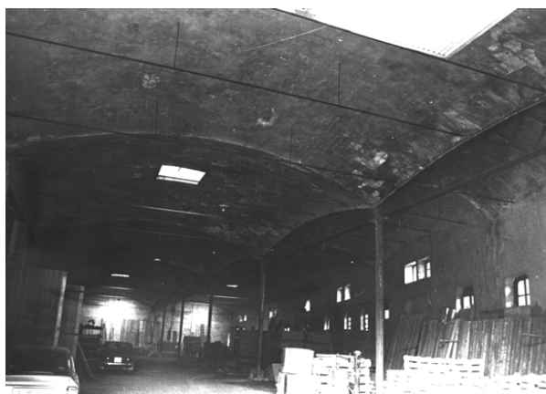
Interior vista general