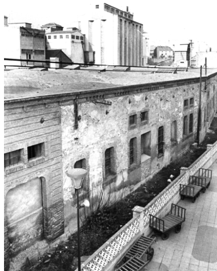
Façana des de les instal·lacions ferroviàries